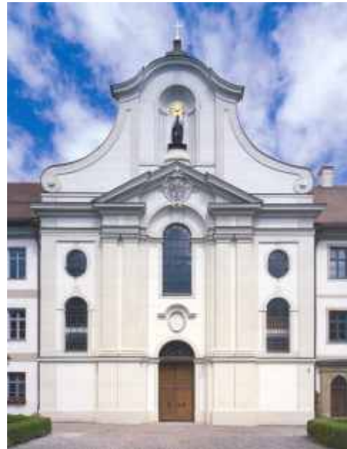
Johann Michael Fischer 1622 - 1766

anlässlich der Wiedereröffnung der ehem. Klosterkirche Rott am Inn vom 7. Juli - 31. August 2002 im Gemeindehaus, Kaiserhof 3, 83543 Rott am Inn